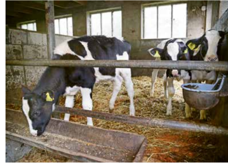
John de Vries gebruikt volop eigen stieren. Alle drie kalveren in dit hok zijn dochters van een eigen stier.