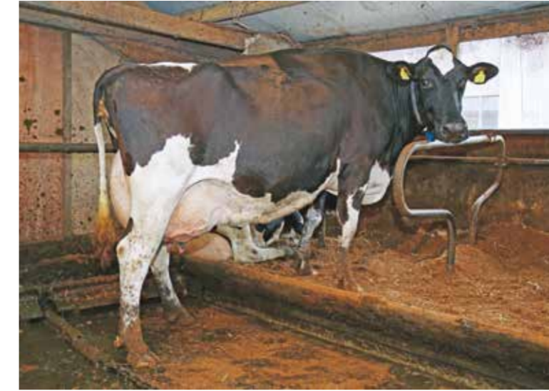
Hellen 585 (Goldwyn x Norik) produceerde tot dusver 90.000 kilo melk en kreeg onlangs de exclusieve score van 93 punten voor het totaal exterieur. Ze is de moeder van de voormalige NRM-kampioene Hellen 589 (v. Shottle).