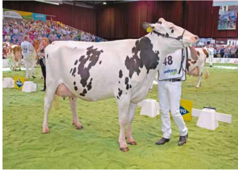
Op de NRM van 2012 werd de tweedekalfs Jimm. Holstein Hellen 589 (Shottle x Goldwyn) verkozen tot kampioene van de middenklasse en later ook algemeen kampioene.