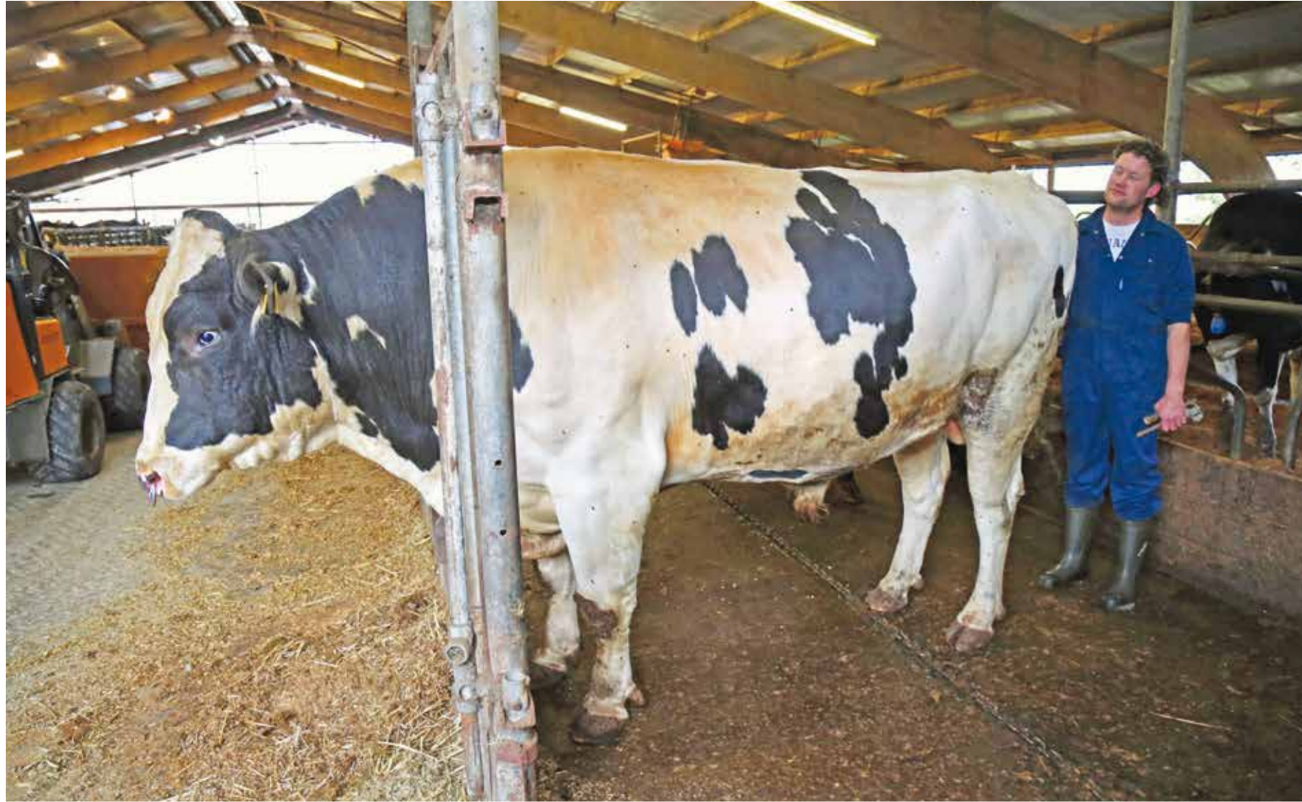
Voorin de stal staat de imponerende dekstier Jimm. Holstein Mr. Mike (Maik x Tiamo). De uiterst correcte stier kreeg 89 punten, de maximale score voor een jonge stier, voor het algemeen voorkomen en meet een kruishoogte van 1,70 meter en een schofthoogte van 1,85 meter. Hij kreeg de aAa-code 465 toebedeeld.